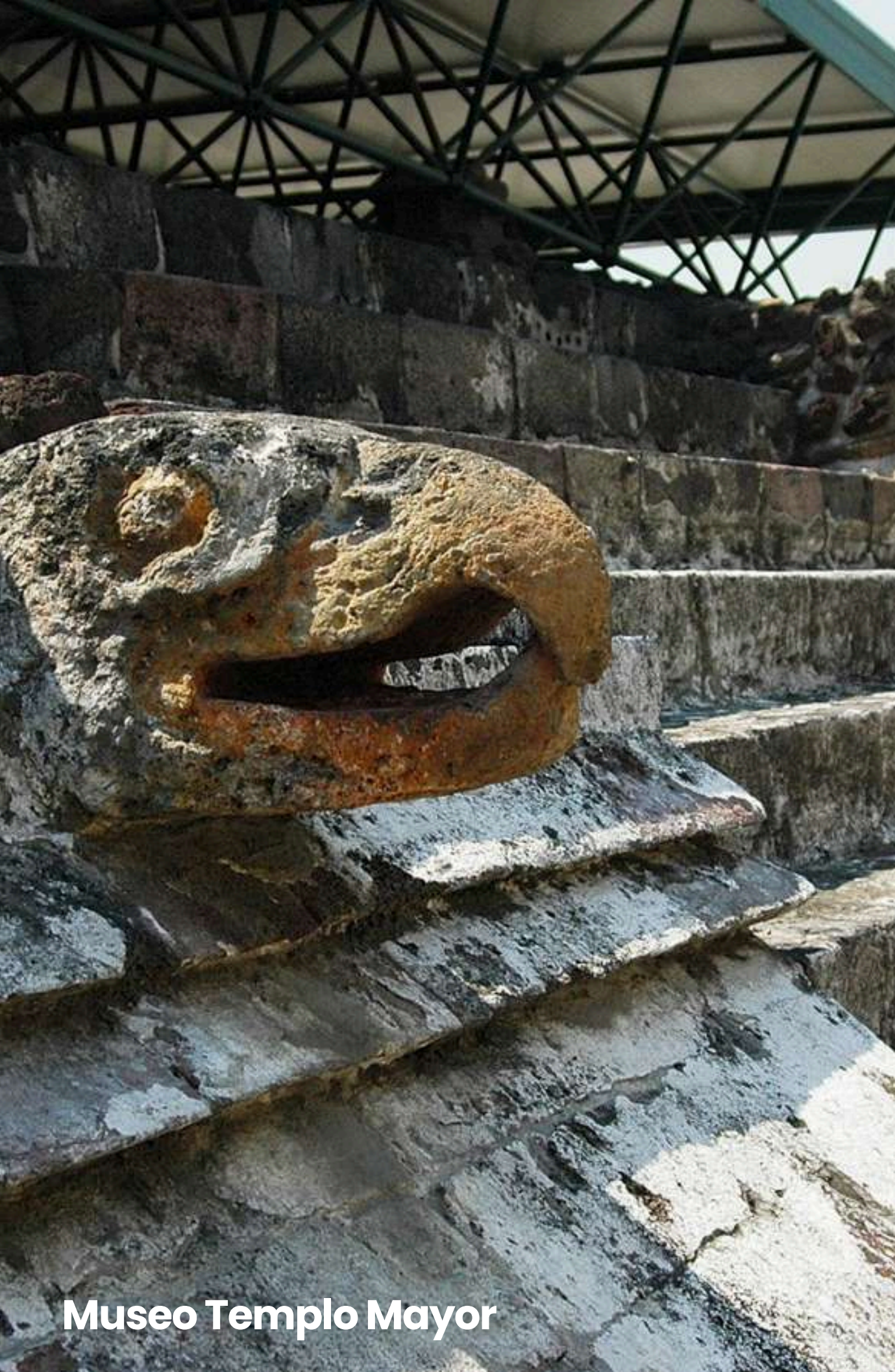
Museo Templo Mayor