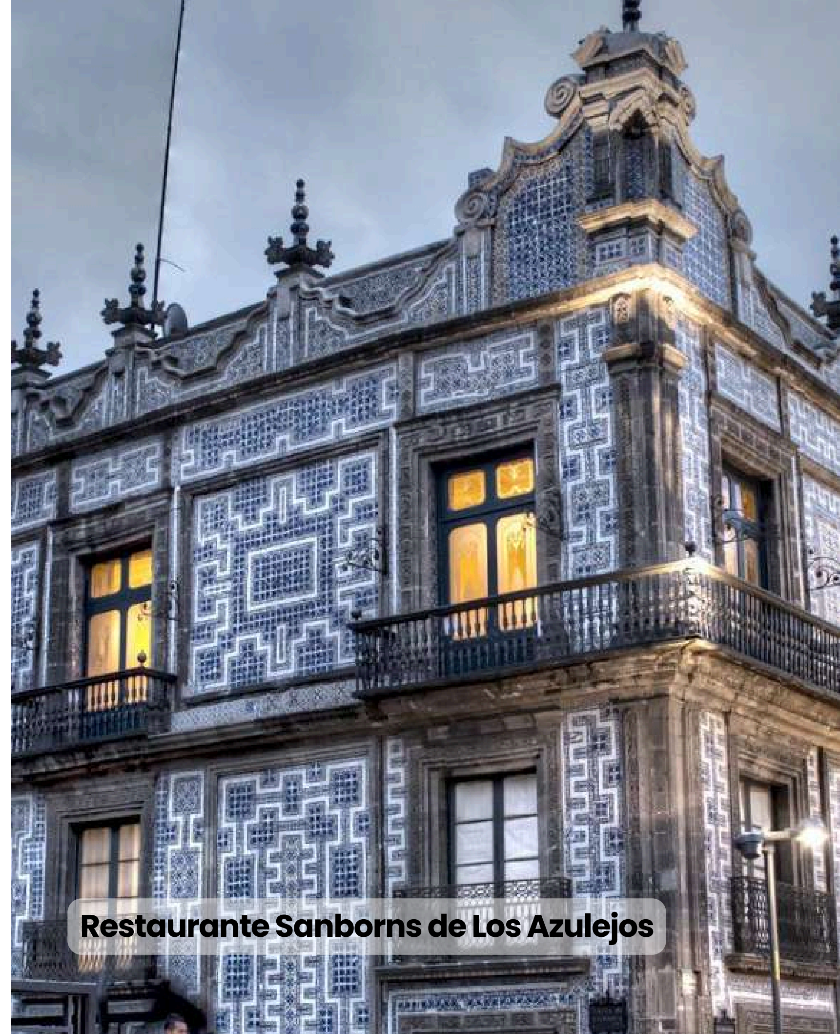
Restaurante Sanborns de Los Azulejos